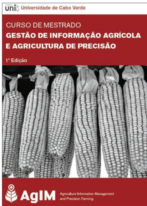
Figura 2 - Brochura do Programa de Pós-graduação e Mestrado AgIM

ta com a colaboração do Instituto Superior de Estatística e Gestão de Informação da Universidade Nova de Lisboa (ISEGI-NOVA) e com o apoio da ESRI-Portugal. O projeto tem as mesmas características do projeto SUGIK e prevê a realização de duas edições e é realizado na Universidade de Cabo Verde e na UCM-Moçambique. À semelhança do SUGIK também visa o estabelecimento de requisitos para a continuidade e sustentabilidade do curso para além do período de implementação, promovendo a capacidade institucional, académica e tecnológica das duas instituições parceiras para oferecer educação de qualidade no campo da Gestão de Informação Agrícola e Agricultura de Precisão. Trata-se de um projeto de cooperação institucional em ensino pós-graduado em Gestão de Informação Agrícola e Agricultura de Precisão, financiado pelo 10º Fundo Europeu de Desenvolvimento (FED) da Comissão Europeia, no âmbito do Programa EDULINK - Programa de Cooperação ACP-EU para o Ensino Superior. A sessão de abertura oficial da primeira edição está prevista para 15 de Setembro de 2014.