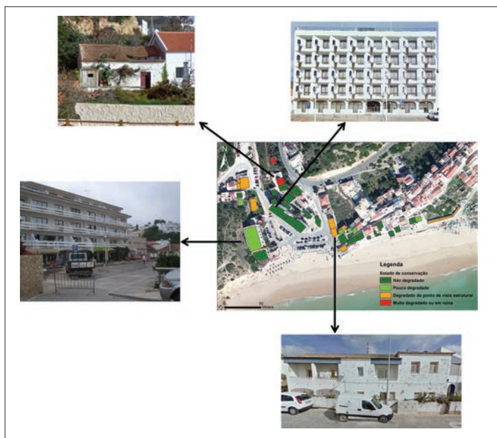
Figura 3 - Representação do estado de conservação dos edifícios a partir de dados recolhidos com a aplicação Collector for ArcGIS ® instalada em dispositivo móvel (Projeto TSURIMA)

Várias metodologias abordam a temática da vulnerabilidade de edifícios face a tsunamis (PAPATHOMA et al. , 2003; PAPATHOMA & DOMINEY-HOWES, 2003; DOMINEY-HOWES & PAPATHOMA, 2007; DALL'OSSO et al. , 2009; KAPLAN et al. , 2009; DALL'OSSO et al. , 2010; ANPC, 2010; OMIRA et al. , 2010; LEONE et al. , 2011; RIBEIRO et al. , 2011; ISMAIL et al. , 2012; BARROS et al. , 2013; EMÍDIO et al. , 2013), recorrendo a um conjunto de parâmetros intrínsecos aos edifícios, recolhidos com base em análise de imagens de satélite e avaliação in loco das características dos edifícios. Estas metodologias consideram um conjunto de parâmetros mais limitado em comparação com a metodologia preconizada pelo projeto TSURIMA, na qual se condensaram e acrescentaram parâmetros não considerados anteriormente, resultando num total de 13 parâmetros diretamente relacionados com o edificado. A Figura 3 dá a conhecer a expressão cartográfica de um desses parâmetros que é o “estado de conservação”. O presente levantamento foi efetuado na praia da Salema, Vila do Bispo, onde foram identificados um total de 44 edifícios potencialmente afetados.