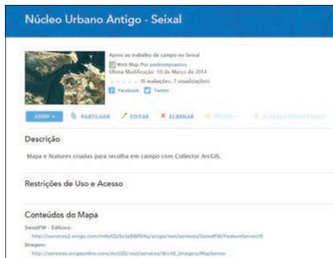
Figura 1 - Resumo do mapa criado em ambiente cloud no ArcGIS Online para recolha de dados no campo

da matriz recolhidos e que auxiliam na análise e avaliação do edificado potencialmente afetado.