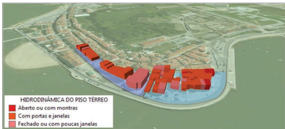
Figura 3 - Representação da altura do edificado e da hidrodinâmica do piso térreo a partir de dados recolhidos com a aplicação Collector for ArcGIS® instalada em dispositivo móvel (Projeto MOLINES)

A tipologia do parque habitacional consiste numa característica relevante no âmbito dos dois projetos de investigação indicados. Com efeito, os edifícios residenciais fazem parte dos elementos expostos mais frequente e severamente afetados diretamente por tsunami e inundação estuarina. Tratam-se igualmente de elementos vulneráveis em termos de valor económico por unidade de superfície (DE MOEL & AERTS, 2011). Ademais, os edifícios redirecionam o seu efeito para a dimensão das perdas pessoais (morte, ferimento, desalojamento e evacuação). As matrizes de avaliação de campo expressam essa relevância em ambos os projetos, com ligeiras diferenças ao nível dos campos e atributos. A Figura 3 ilustra um output preliminar produzido no âmbito do projeto MOLINES que combina a altura dos edifícios com a hidrodinâmica do piso térreo, em duas subsecções estatísticas da área do Núcleo Urbano Antigo do Seixal. Os edifícios com um único piso - não considerando os restantes parâmetros - são teoricamente os mais vulneráveis porquanto não permitem quer a evacuação e permanência de pessoas quer a mobilização do recheio das habitações para outros pisos dentro do mesmo edifício. O cruzamento dos diversos parâmetros irá permitir uma adequada caracterização da vulnerabilidade do edificado.