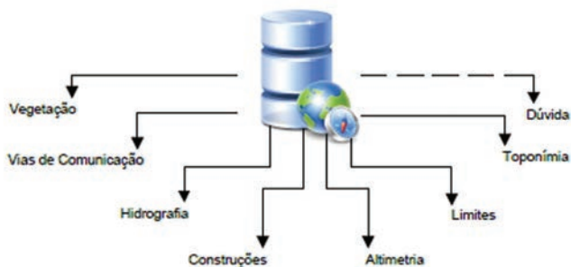
Figura 2 - Estrutura da nova base de dados geográfica a utilizar pela aquisição

uma atributo (larga ou estreita no caso das estradas e carreteiro ou pé posto no caso dos caminhos) distinguindo desta forma o que anteriormente pertencia a diferentes tabelas da base de dados.