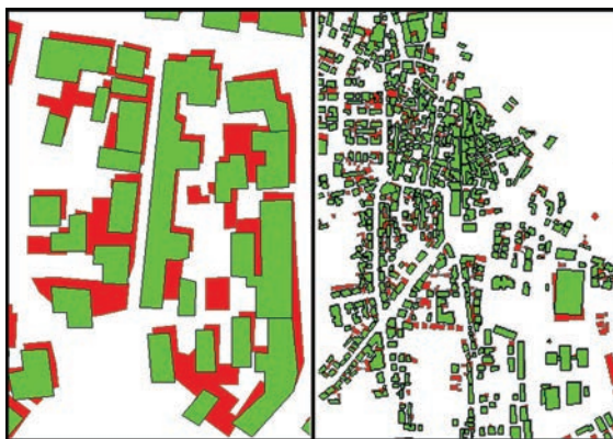
Figura 4 - Comparação da versão de 2001 (a verde) com a versão de 2003 (vermelho) da informação adquirida por métodos fotogramétricos e em diferentes escalas

exatidão posicional dos dados adquiridos substancialmente superior ao que era possível em versões anteriores, o que complica o processo de decisão. Dependendo sempre da escala a que se pretende representar, tal como se pode verificar na Figura 4, o facto de se assumir uma discrepância em dados referentes ao mesmo objeto mas em edições diferentes poderá representar uma enorme redução no tempo de trabalho de cada folha, significando isso obviamente uma redução do ciclo de atualização assim como uma redução de custos a ela associados.